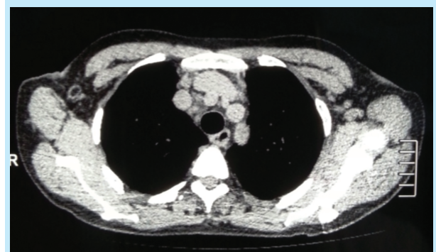
Figure 3 : Tomodensitométrie thoracique montrant des ganglions et des adénomégalies médiastinales hilaires diffus.